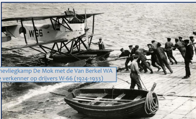
Marinevliegkamp De Mok met de Van Berkel WA lichte verkenner op drijvers W-66 (1924-1933)