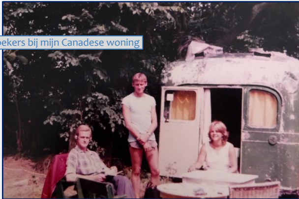
Bezoekers bij mijn Canadese woning

Uiteindelijk vond ik onderdak in het huttedorp van Bolle Piet nabij De Koog. Hij dankte zijn bijnaam niet – zoals je zou verwachten – aan zijn omvangrijke buik, maar zoals zijn andere bijnaam luidde de sneeuwklonkenkoning van Texel , om het feit dat hij als enige in staat scheen sneeuwklonkjes generatief te vermeerderen.