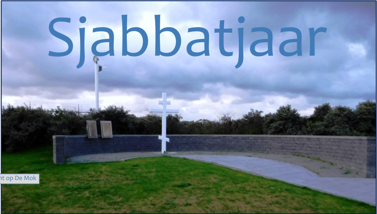
Monument op De Mok

Dit zal de kortste wadlooptocht ter wereld zijn dat kan haast niet anders. Wat is een wadlooptocht eigenlijk, bestaat er een definitie van? De behoudende wadloper zal gauw zeggen dat zo'n tocht alleen in het Deens-Duits-Nederlands waddegebied gelopen kan worden en uitsluitend telt wanneer het een