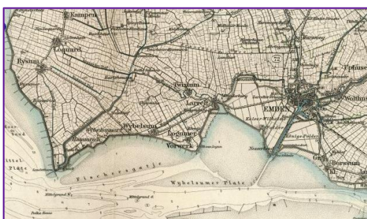
L: Emden en omgeving in 1901

Ook nu is de werkelijkheid weer veel minder romantisch. Spoedig krijgen we tientallen van dit soort plaatjes te zien. Hier wordt de as der dierbaren uitgestrooid in het kostelijke water van de Dollard. Mensen begraaf toch uw doden! En leg ze veilig in de schoot van moedertje aarde! Bezoedel het water niet!