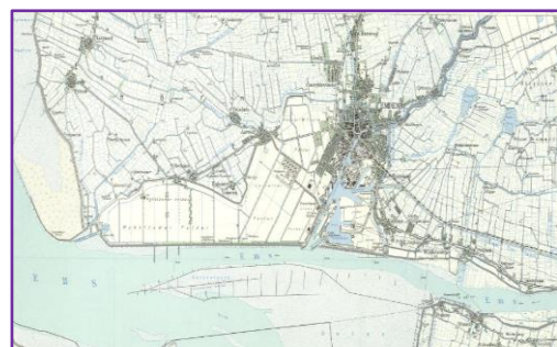
R: Emden en omgeving ca. 2000

We staan even stil bij het gemaal Knock. Groot is het en vol van historie. Hoe lang al vecht de mens tegen het water? En hoe lang nog zal dat doorgaan? Dat wordt allemaal gememoreerd. Indrukwekkende plakaten en standbeelden die herinneren aan heldendaden en mannen uit het verleden, mannen van een grote voornaamheid.