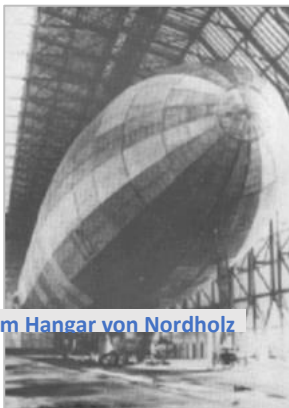
L 21 im Hangar von Nordholz

"Am 17. Dezember 1912 beauftragte der Staatssekretär des Reichsmarineamtes, Großadmiral Alfred von Tirpitz, die Kaiserliche Werft Wilhelmshaven mit dem Bau eines 800 ha großen Marinestützpunktes in der Heidelandschaft bei Nordholz. Das Gebiet erfüllte alle besonderen Anforderungen für den Standort des Marinestützpunktes: es war ein zentral gelegenes Gelände ohne allzu große Militärpräsenz, günstig zu erwerben und durch das vorgelagerte Watt gegen Beschuss von See aus gesichert."